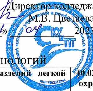
График приема вступительных испытаний в ГПОУ ЯО Ярославский колледж управления и профессиональных технологий